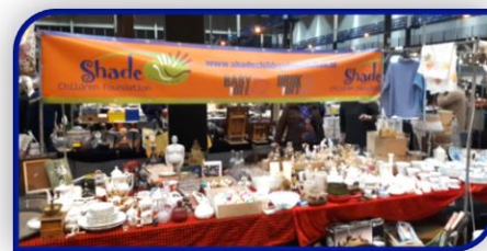
Gorinchem febr., de enige en laatste markt waar wij in 2020 gestaan hebben.

We hebben bewust de jaarlijkse acties die geen inkomsten genereerden door de Coronamaatregelen op nul laten staan, zodat de impact ook zichtbaar wordt. De markten en de verkoop via Facebook werden helaas onmogelijk door de beperkingen. De Wijnactie werd bemoeilijkt doordat de grenzen met België dicht waren en de mogelijkheid tot contacten/aflevering zeer beperkt. Gelukkig bleef onze vaste afnemer, Makelaardij Van Wensen in Klundert, huizen verkopen en werd daardoor de afname van flessen wijn als attentie bij de overdracht, voortgezet. Wellicht ook iets voor uw bedrijf?